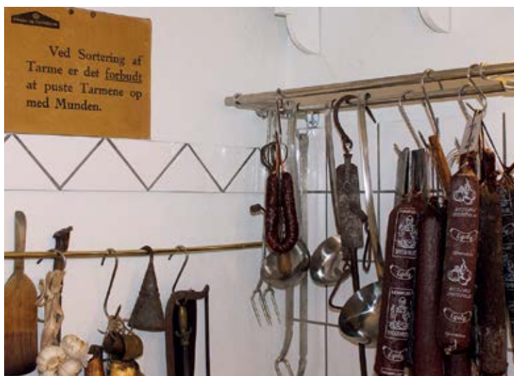
Instruksen fra Arbejds- og Fabriktilsynet hos slagteren er ikke til at misforstå...