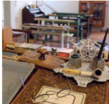
Frøkenens briller ligger klar i skolestuen, som er fyldt med gamle lærebøger og nyttige anskuelsestavler.

- Det er Danmarks største private samling, og mange af vores gæster spørger forundret ind til, om det virkelig er én mands værk, fortæller han. Når jeg så bekræfter,