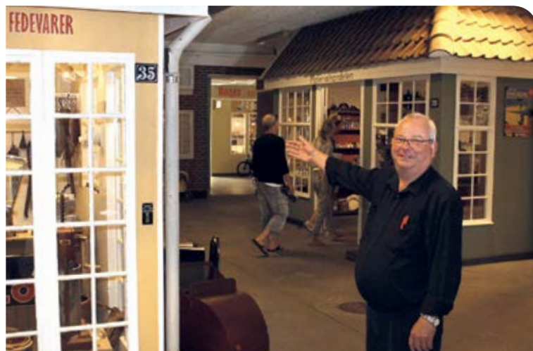
Samleren selv viser gerne rundt på sit storslåede museum.

- Folk er tiltrukket af energien her, og det er jeg kiste-