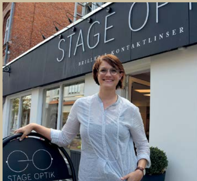
Charlotte Stage: - Du har altid et valg, er mit slogan.