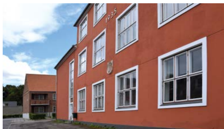
Højskolen Møn ligger midt i Stege – i to sjælfule huse, der tidligere rummede både folkeskole og teknisk skole.

Om det er pennen, kameraet, mikrofonen eller penslen, der skal i sving, er helt op til deltagerne selv. Og man vælger selv op til 75 % af de tilbud, højskolen udbyder. De sidste 25 % er for alle, så der er noget at være fælles om.