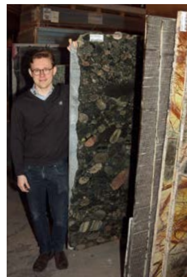
Martin i skæreriet, hvor over 80.000 m 2 fliser, klinker og natursten er på lager.