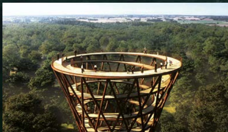
Flyv fx forbi Skovtårnet, Danmarks nye turistattraktion, som i åbningsåret sidste år passerede 200.000 besøgende.

Normalpris 1.200 kr., men oplys rabatkoden MØN og kom afsted for kun 995 kr. alt inkl. Rigtig god tur!