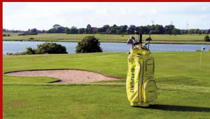
Kom og nyd en dag – eller to – i golfens tegn på Møn Golf-center, som ligger særdeles naturskønt.

og skal meldes på www.moensbank.dk/140 , hvor bankens jubilæumsaktiviteter alle er samlet. Deltagere skal være fyldt 18 år.