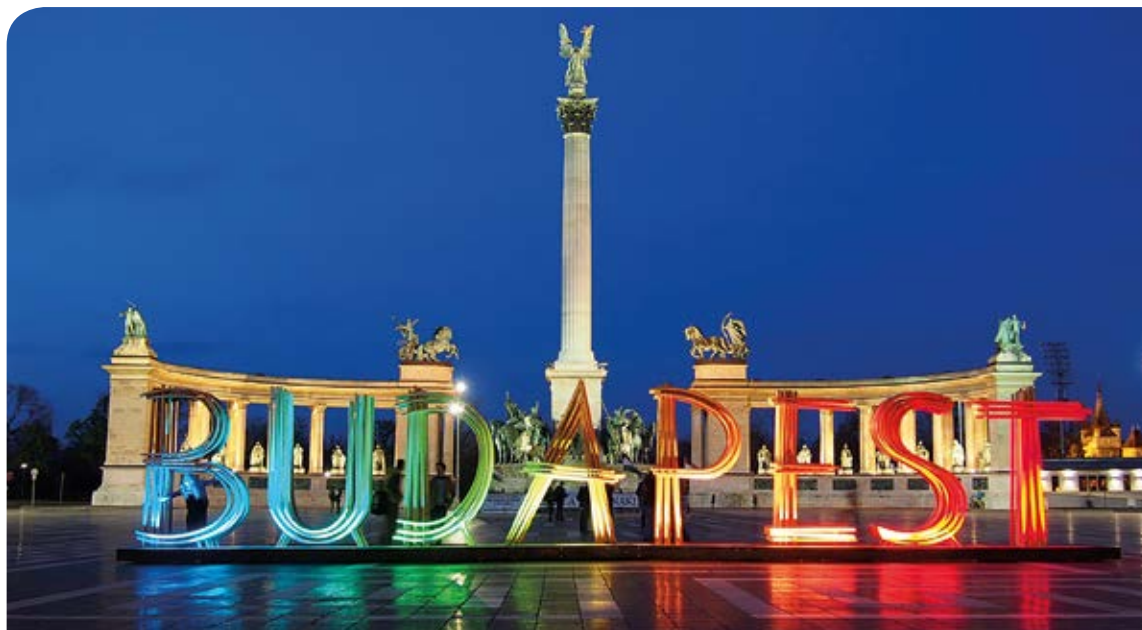
Heltepladsen med Tusind-årets flotte kolonnader.

der viser deres færdigheder med og på hest. Hestene var før i tiden deres ét og alt, når de red ud over Pusztaen. Uden hest var de intet. De spiste, sov og arbejdede sammen fra morgen til aften. At blive en dygtig rytter kræver træning helt fra barnsben. Vi kommer til at opleve et flot show, der også er fyldt med humor.